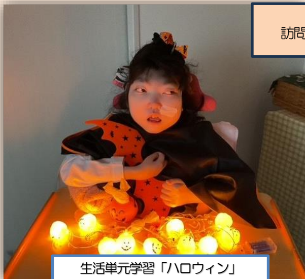
生活単元学習「ハロウィン」