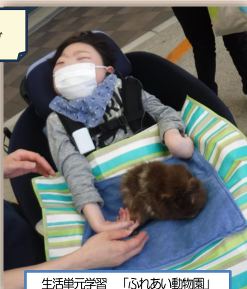
生活単元学習「ふれあい動物園」

本校には、通学が難しい児童・生徒のために、教員が御家庭等に訪問して授業を行う「訪問学級」があります。個に応じた課題の学習を行うとともに、所属している学年や学習グループの友達と同じ学習に取り組むこともあります。保護者の付添いのもと学校に登校（スクーリング）したり、オンラインで自宅と学校をつないだりして、学校での授業や行事等に参加することもあります。