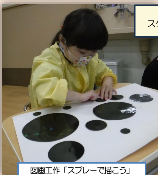
図画工作「スプレーで描こう」