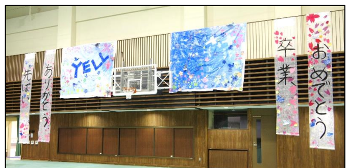
【就業技術科 三年生を送る会での一幕】