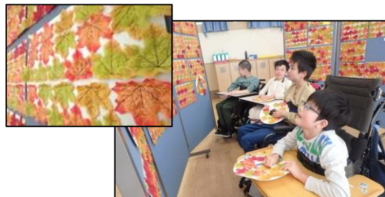
肢体不自由教育部門 中学部 季節を題材にした授業の様子