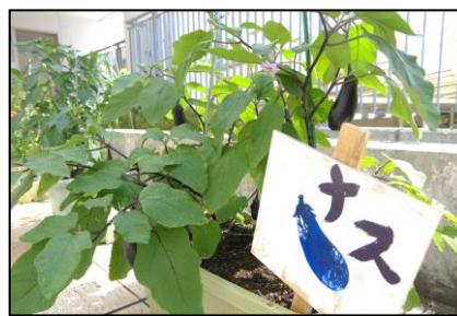
【肢体不自由教育部門 高等部で栽培している野菜たち】