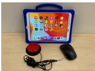
【 スイッチ活用 タブレット編 アプリをスイッチで操作する 】

スイッチを接続する改造マウスを使います。 (左クリックを外部から操作できるようにします)