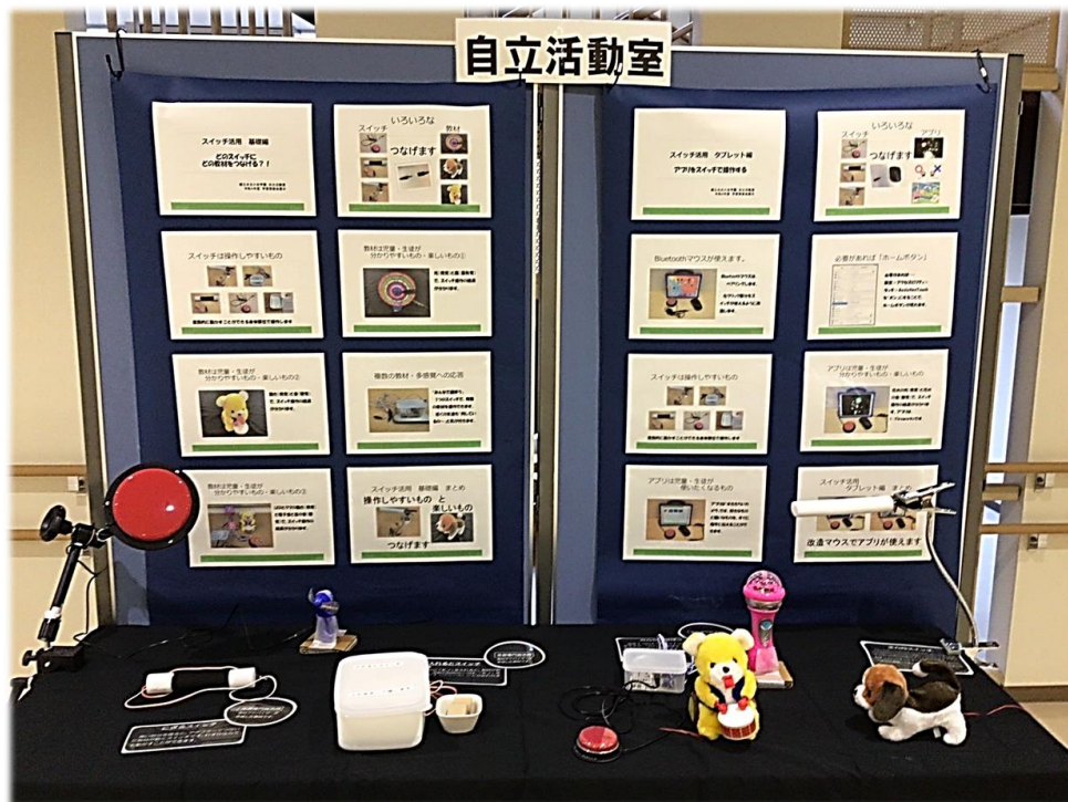
【 スイッチ活用 基礎編 どのスイッチにどの教材をつなげる?! 】