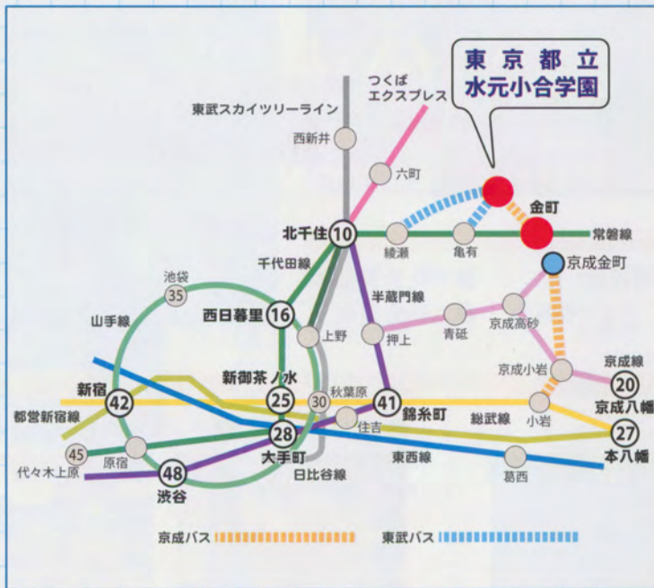
金町駅までの所要時間