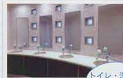
トイレ・洗面台 (シャワートイレ完備)