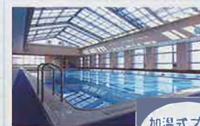
加温式プール (全天候型屋内プール)