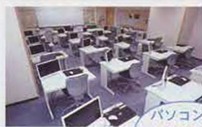
パソコン室 (一人一台のノートパソコンと中間モニター)