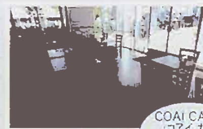
COAI CAFE コアイカフェ (学校専用カフェ)