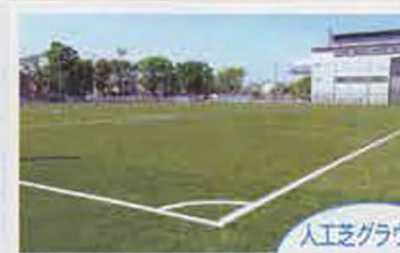
人工芝グラウンド (水元総合スポーツセンターの利用)