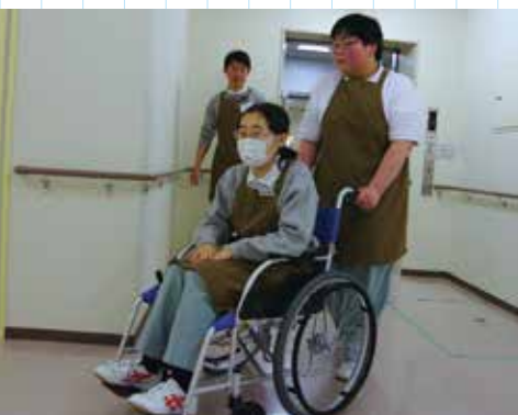
▶ビルメンテナンスに関連する内容 (業界団体の清掃マニュアルに基づく日常清掃や定期清掃業務)