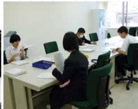
▶ 事務、情報処理に関連する内容（オフィスでの事務や事務補助の業務）