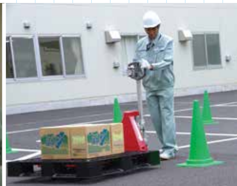
▶ 流通・販売事務・商品管理に関連する内容（物流サービス業務）